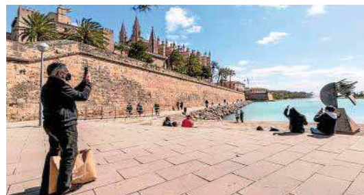
Varios turistas en Palma de Mallorca.