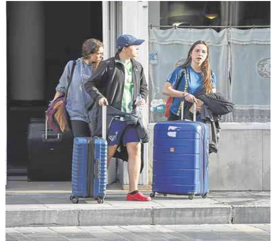
Turistas a la puerta de un hotel situado en el centro de Gijón.

El «furor viajero» que se ha desatado no tiene precedentes, asegura el vicepresidente de Exceltur, que cifra en casi 152.000