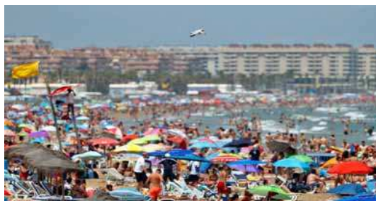
Una playa de Valencia, repleta de gente.