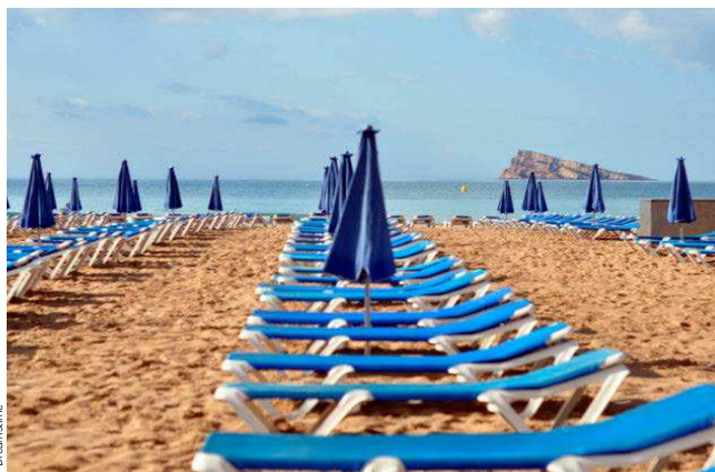
Las consecuencias de la pandemia: una imagen de hamacas vacías en la playa de Benidorm.

Con la entrada en un 2021 que prolonga la agonía, el turismo arrastra ya 14 meses de travesía por el desierto, con una sangría de miles de millones y sin perspectiva de recuperar lo perdido. Una catástrofe sin precedentes que ya ha destruido 32.000 empresas del sector y afecta a 841.436 empleos, según datos de Exceltur. El problema es que, dado el peso que tiene el turismo en la economía