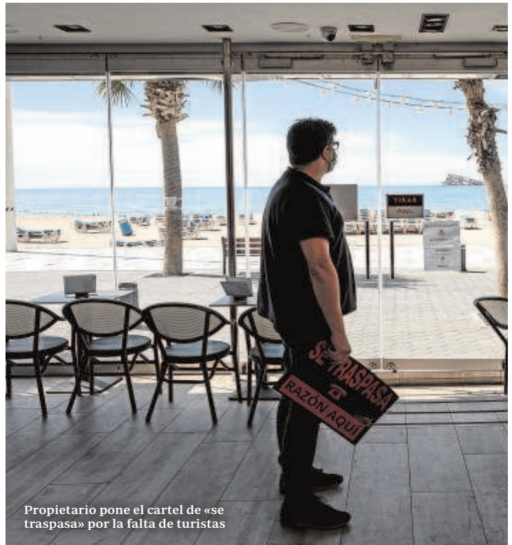
Propietario pone el cartel de «se traspasa» por la falta de turistas

Pero no solo se vio el sector lastrado por la caída de los visitantes internacionales, sino también por el descenso de la demanda nacional, que se desplomó un 50%, y no enderezó demasiado esta cifra ni siquiera en verano cuando las restricciones fueron mínimas y solo en algunas regiones. De esta manera, Exceltur señala que la tendencia de los españoles ha sido la de viajar por los entornos controlados y de proximidad, usando vehículo propio y alojamiento no compartido, además de disminuir su consumo en restauración. Medidas, todas ellas, para protegerse del virus.