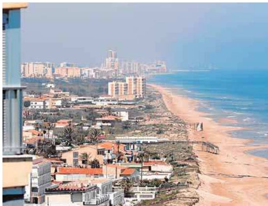
Las playas al norte de Cullera, ayer, completamente vacías.