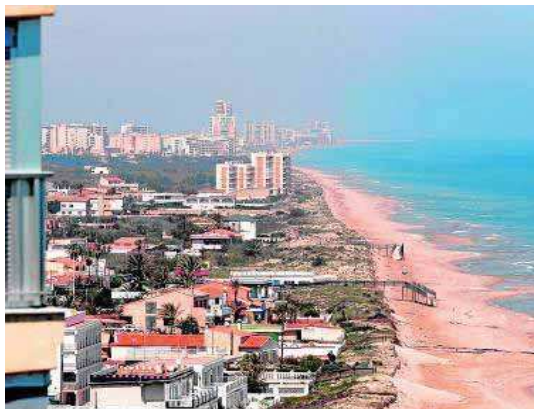
Las playas al norte de Cullera, ayer, completamente vacías.