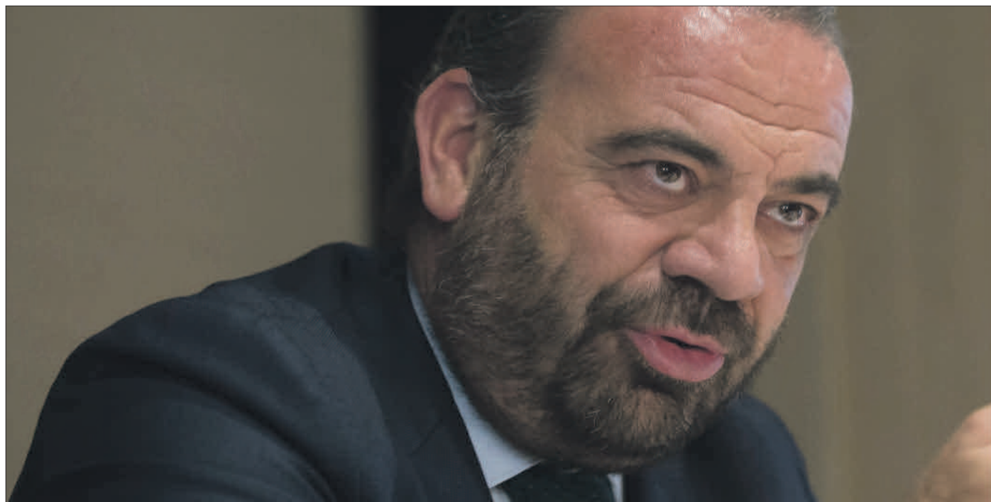
Gabriel Escarrer Presidente de Exceltur y vicepresidente ejecutivo de Meliá Hotels International