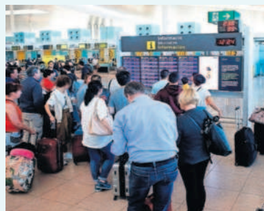
Pasajeros observan horarios de vuelo ayer por la mañana al aeropuerto de El Prat (Barcelona).

El informe del citado organismo revela que la cercanía del Brexit ya produjo una caída de ventas al mercado británico en verano. En concreto revela que la cifra de negocio ligada al Reino Unido bajó un 3% en temporada alta en todos los sectores y todas las comunidades autónomas. Entre las actividades más afectadas se encuentran los hoteles de costa, con un ajuste de ventas del 4,4% respecto al mismo periodo de 2018, y los urbanos, con un retroceso del 3,6%. El retroceso ha sido generalizado en todas las grandes autonomías turísticas (Cataluña, Baleares, Canarias, Andalucía, Comunidad Valenciana y Madrid concentran el 90% del turismo extranjero), aunque fue especialmente acusado en Canarias, con una caída del 7,2%, seguida por Baleares (-3,5%), Andalucía