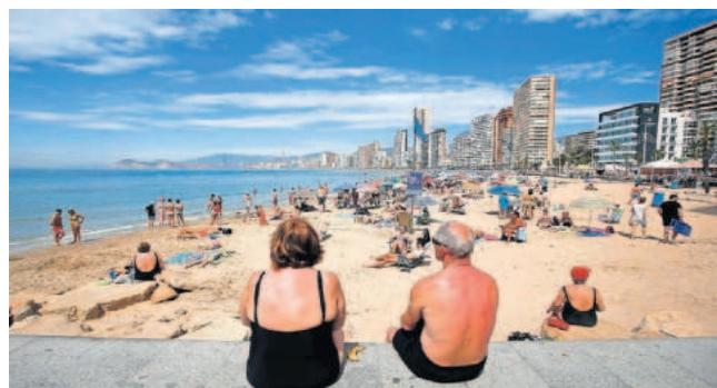
Turistas en la playa de Benidorm.