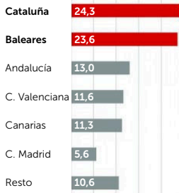
LLEGADAS DE TURISTAS INTERNACIONALES (% respecto del total, julio 2017)