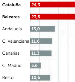
LLEGADAS DE TURISTAS INTERNACIONALES (% respecto del total, julio 2017)