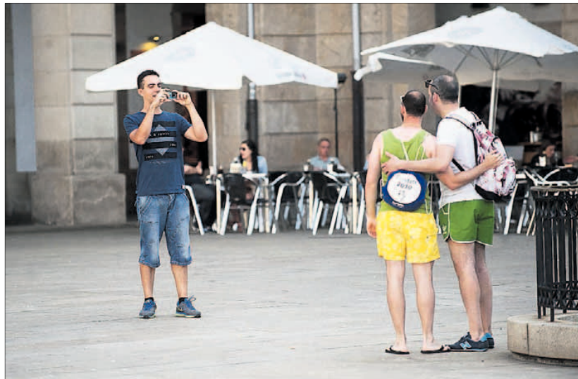
Dos turistas posan para una fotografía, en la plaza de María Pita.

Esta clasificación tiene en cuenta el índice RevPar, que es el