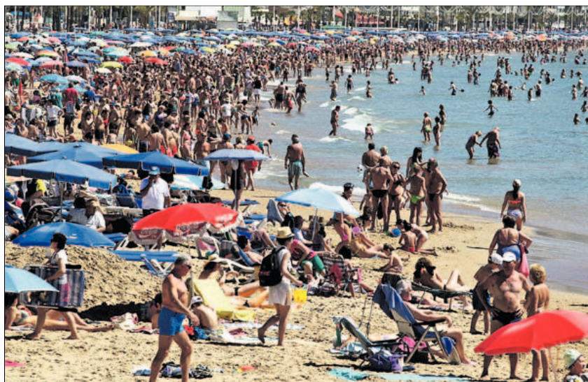
Turistas en la playa de Benidorm (Alicante).

Los datos del pasado ejercicio han invertido la tendencia que se produjo en los seis años de crisis, cuando el gasto crecía a tasas sensiblemente inferiores a las de las llegadas de visitantes. En 2016, el gasto se incrementó en 10.000 millones de euros, hasta los 77.000 mi-