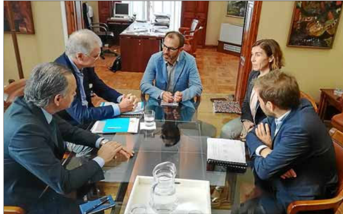
El conseller Biel Barceló , en la reunión de ayer con los representantes de Exceltur .

González añadió que la proliferación de viviendas vacacionales «ha sido incómoda, de ahí que urge una regulación severa contra estas plataformas».