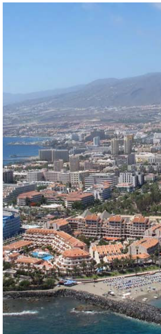
Adeje y Arona son las localidades turísticas que más empleo crean en Tenerife.

Solo San Bartolomé de Tirajana y Benidorm superan las CIFRAS DE ADEJE