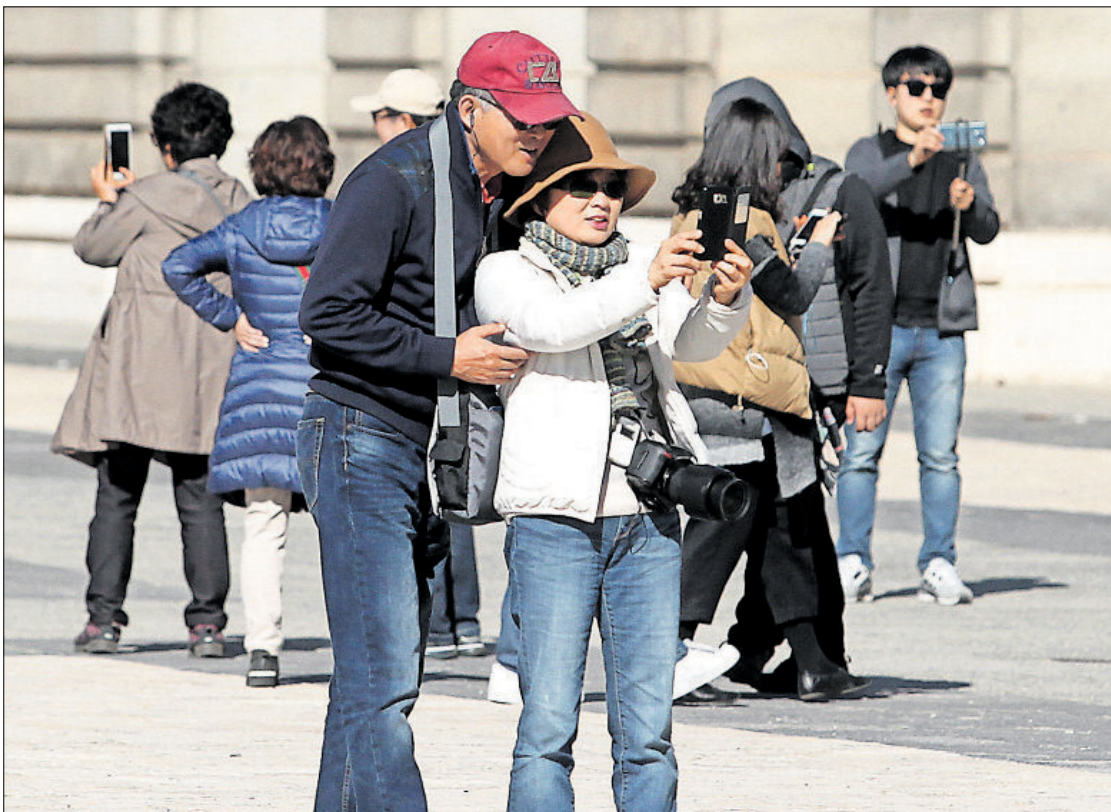
Un grupo de turistas, ayer en la plaza de Oriente.